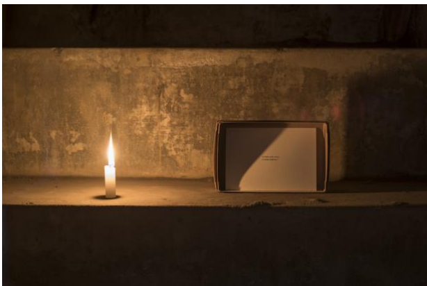
「この空間には争いがない／この部屋には壁がない」と書かれたカード